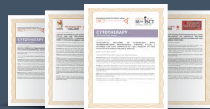
具科学研究报告肯定